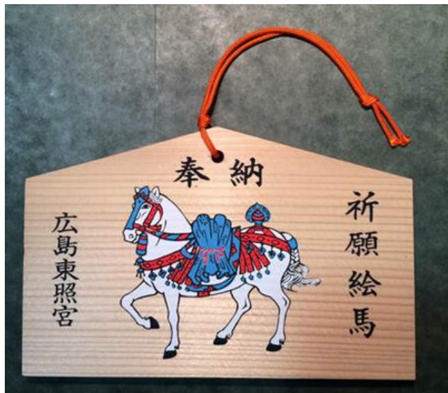
Museum of International Folk Art, Education Collection

La práctica de escribir un deseo personal o oración en una placa de madera, llamada ema , generalmente tiene lugar en los santuarios Shinto de todo Japón. Esta práctica se remonta al período Nara en el siglo VIII, cuando los miembros de la aristocracia y más tarde la élite militar donaban caballos (se cree que son vehículos de los dioses) al santuario local junto con deseos de protección de alguna fuerza negativa. Eventualmente, las placas pintadas con imágenes de caballos llegaron para reemplazar a los animales reales como las ofrendas , y para el período Muromachi (siglos XIV - XVI), el tema de las placas se expandió más allá de las imágenes de caballos, aunque el nombre ema permanece (e significa "pintura o imagen;" ma significa "caballo").