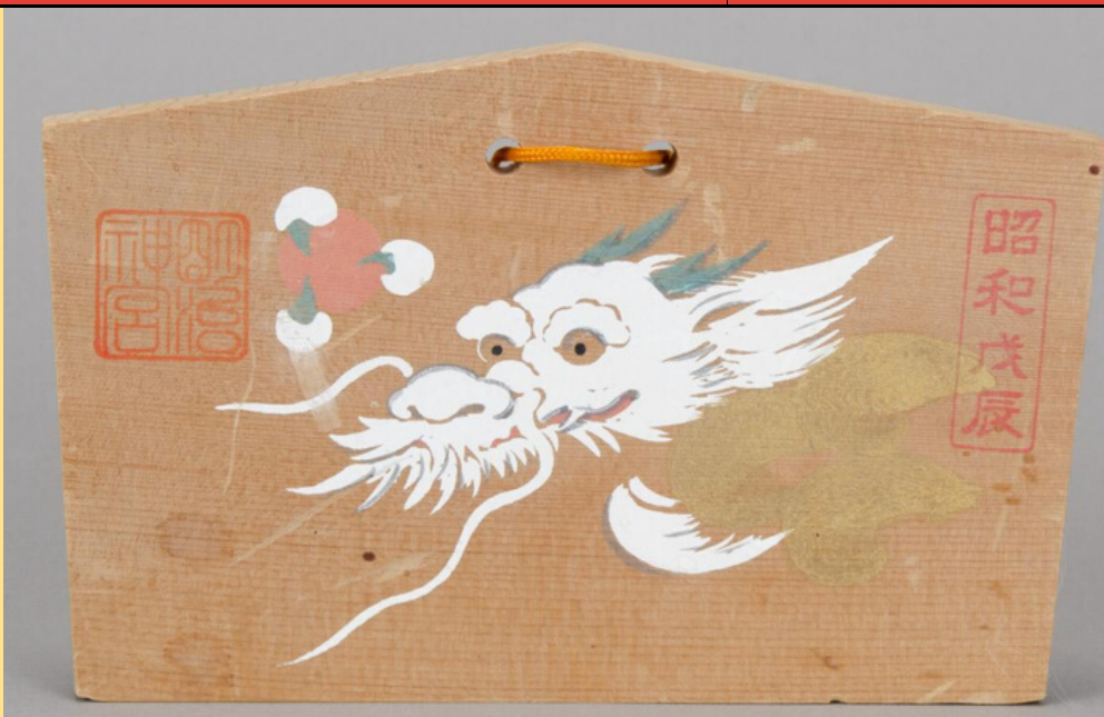
Temple offering. Tokyo, Japan. Museum of International Folk Art, gift of James McGrath