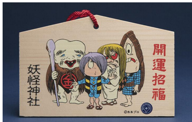
Ema depicting yokai characters from the manga series, "GeGeGe no Kitaro". Totori Prefecture, Japan. 2018, Museum of International Folk Art, IFAF Collection.

En la actualidad Ema es reconocible como una pequeña placa de madera con una imagen pintada en el frente, a menudo acompañada por la palabra gan-i (que significa "deseo"), y una cuerda a través de un agujero en la parte superior para colgarla. El borde superior tradicional en forma de techo triangular está destinado a evocar el techo inclinado de un establo de caballos, que se remonta a los orígenes de Ema. Hoy en día, una amplia variedad de formas de ema se pueden ver: otros animales como la cara de un zorro ( inari ), o personajes de la cultura popular como rilakkuma y Hello Kitty . Incluso en el ema de forma tradicional, una amplia gama de imágenes están disponibles, desde los 12 animales del zodiaco (especialmente populares durante la temporada de Año Nuevo), hasta imágenes de guerreros heroicos o símbolos auspiciosos. Por supuesto, la imagen original de un caballo también se puede encontrar.